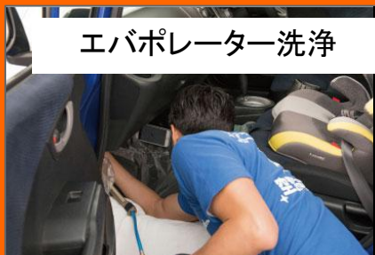
エバポレーター洗淨