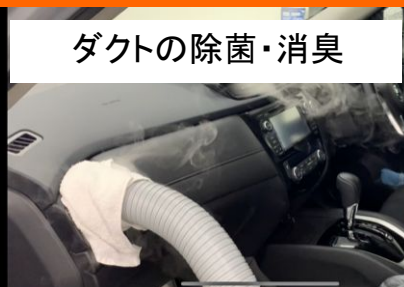
ダクトの除菌・消臭